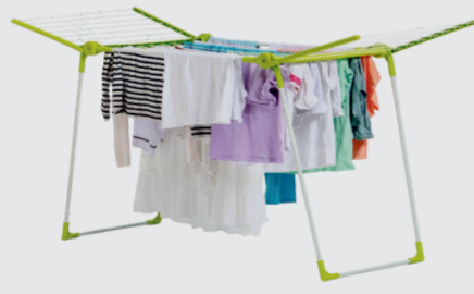
suszarki na pranie