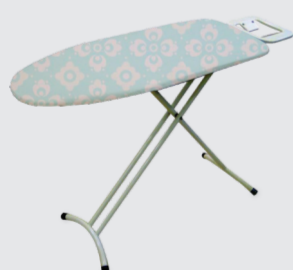
deski do prasowania