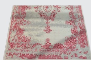
dywany i wykładziny