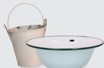
duże miski i wiadra